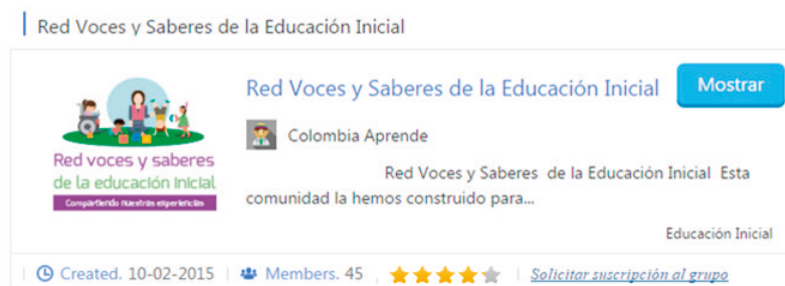
Comunidad red voces y saberes de la educación inicial.