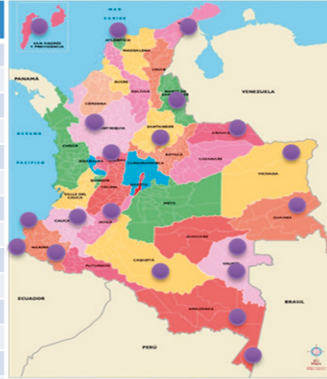
Relación y mapas de encuentros presenciales con educación inicial.