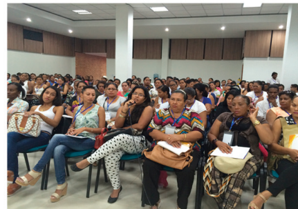
Riohacha - Guajira