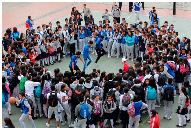
El derecho a bailar, educación escolar.