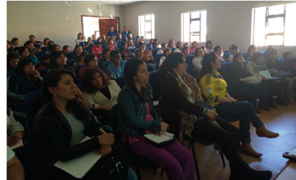
Pasto - Nariño