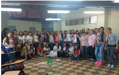
Envigado - Antioquia