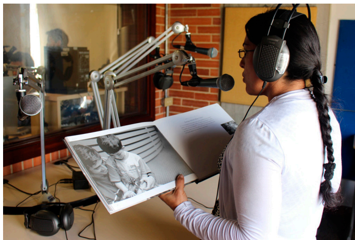
Docente aprendiendo a usar la radio con el fin de consolidar posibilidades para trabajar los derechos de los niños y las niñas en su colegio.